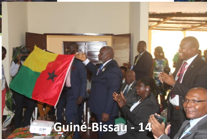
Guiné-Bissau - 14