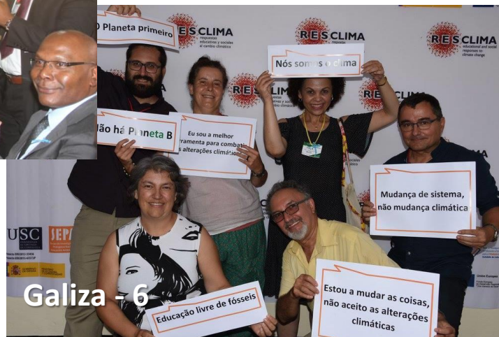
Galiza - 6