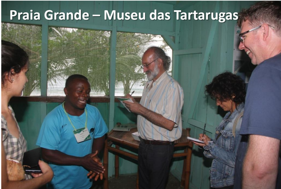
Praia Grande – Museu das Tartarugas