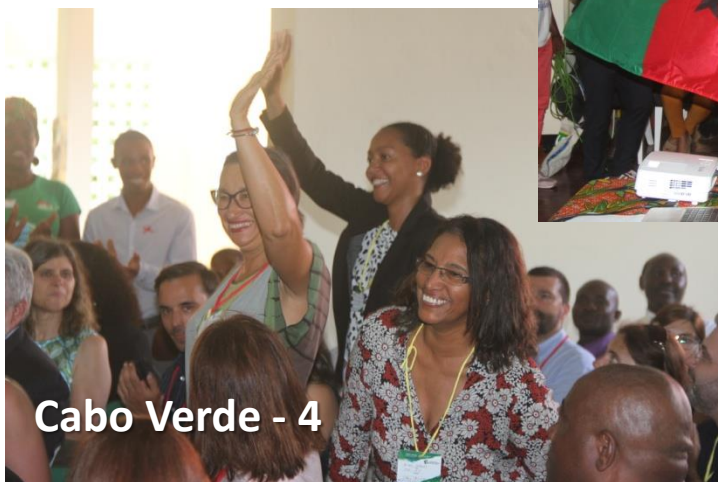
Cabo Verde - 4