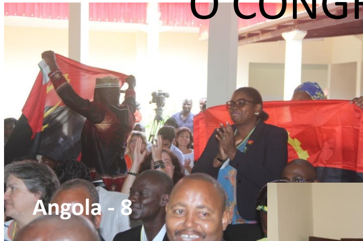
Angola - 8