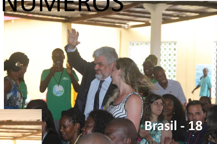
Brasil - 18