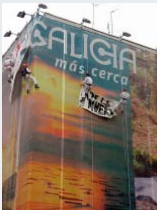
Ecoloxistas en Acción en una acción de denuncia en Madrid.