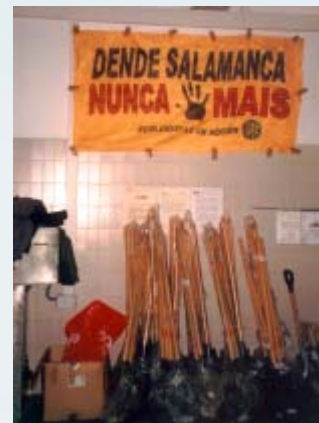
Ecoloxistas en Acción de Salamanca ha enviado material y voluntarios a O Grove para colaborar con la Cofradía de Pescadores.

El fuel incrementará la mortandad en la fase embrionaria, dañando a las especies que realizan las puestas en los sedimentos marinos, y produciendo un descenso en la supervivencia de la fase larvaria. El pulpo común y el calamar serán los más perjudicados, seguidos del choco, el pulpo cabezón y, a un nivel sensiblemente inferior, las potas y voladores. □