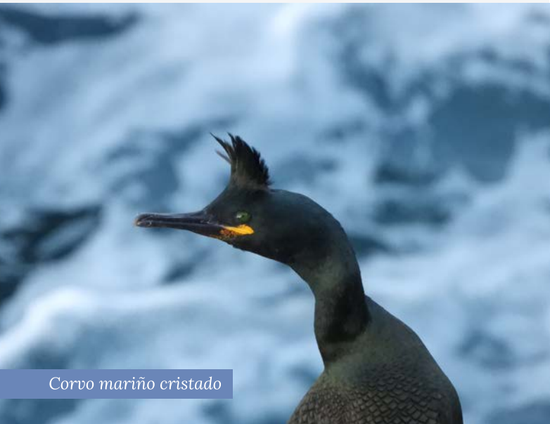
Corvo mariño cristado

Os corvos mariños cristados están moi ocupados coa súa nova familia. Os rechamantes penachos dos adultos locen espectaculares. O golfo Ártabro preserva a súa principal poboación continental, concentrada sobre todo no Monumento Natural da Costa de Dexo. É unha especie moi ameazada polo enmalle en redes en augas de pouca profundidade. O Proxecto ÁRTABRO2 estudou esta problemática e a súas posibles solucións.