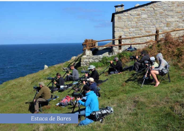
Estaca de Bares

Desde sempre, as aves mariñas axudaron ás persoas profesionais do mar a localizar bancos de pesca. Hoxe seguen a ser as súas aliadas: funcionan como sinais vivas do estado de saúde do mar: por elas sabemos, por exemplo, se hai contaminación mariña. Protexéndoas, ademais, protexemos a outras especies, e ao conxunto do medio mariño. Por se fora pouco, aportan riqueza ao territorio a través do turismo de natureza.