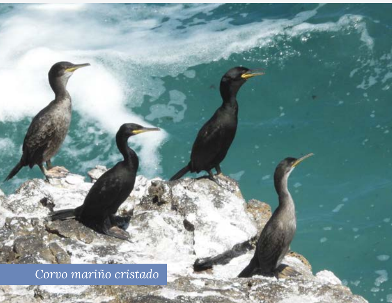
Corvo mariño cristado

Os corvos mariños cristados máis novos reúnen-se en grupos chamados “gardarías”, onde comezan a relacionarse socialmente e os pais continúan a alimentalos durante semanas. Neste momento comezan a desenvolverse na auga e moitos son vítimas do enmalle en redes. Posibles solucións son: evitar calar as artes nas proximidades de colonias de cría, pousadoiros ou durmidoiros, empregar estas artes preferiblemente a máis de 30 m de profundidade, e calar en horario nocturno, cando as aves están menos activas.